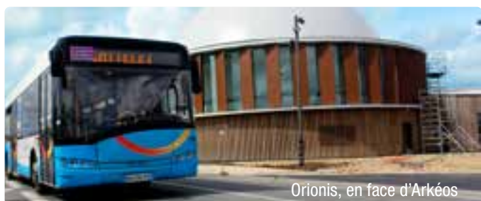
Orionis, en face d'Arkéos

Par ailleurs, le 13 mai 2023, le planétarium Orionis a ouvert ses portes à proximité immédiate du musée Arkéos. 100 000 visiteurs y sont attendus par an. À cette occasion, l'arrêt «Arkéos» est rebaptisé «Arkéos-Orionis». Pour permettre, notamment aux scolaires et aux centres aérés, de s'y rendre aisément, évéole augmente la fréquence de la ligne 16 à compter du 8 juillet. Une offre est également proposée les dimanches après-midi et jours fériés. Pour que chacun puisse avoir la tête dans les étoiles !