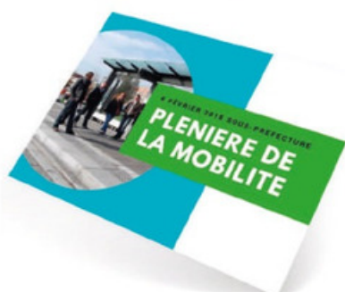
SCHÉMA DIRECTEUR DES MODES DOUX : DÉVELOPPER LA MARCHÉ À PIED ET LE VÉLO

Pour lutter contre la pollution et l'encombrement des routes, mais aussi encourager à la pratique des modes alternatifs à la voiture individuelle, le SMTD a lancé en 2018 un Schéma Directeur des Modes Doux, dont l'objectif est de faire progresser le vélo et la marche à pied dans le Douaisis.