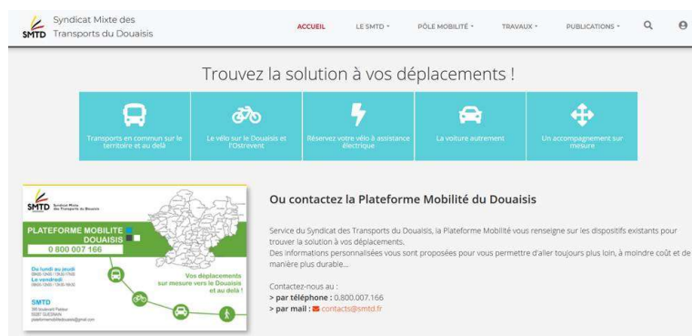
Interface du site Internet du SMTD permettant aux usagers d'obtenir de multiples informations de mobilité

Pour 2021, le guide a été totalement repensé. Une version web est aujourd'hui proposée et accessible depuis le site Internet du SMTD : www.smttd.fr Cette nouveauté permet d'avoir accès à tout moment aux informations mobilité du territoire. L'ensemble des renseignements présentés dans le Guide Mobilité y ont été intégrés et sont disponibles directement depuis la page d'accueil :